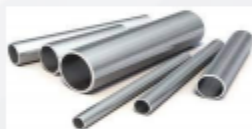
Трубы стальные - 22%