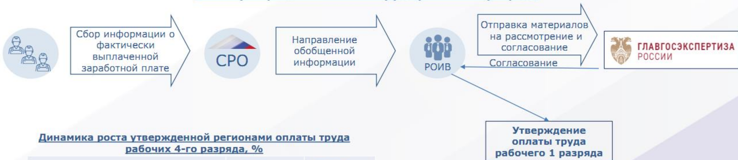
Схема утверждения оплаты труда рабочих 1 разряда