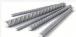
Сталь – 33%