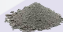
Портландцемент - 22%